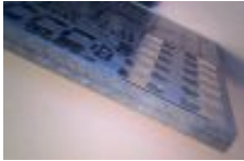
Detailný pohľad roh "bielej" dosky - detail opracovania