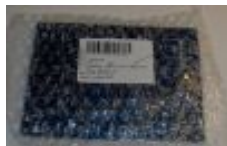
Pohľad na balenie dodaných dosiek

Balenie bolo bežné. Dosky boli zatavené v bublnkovej fólii.